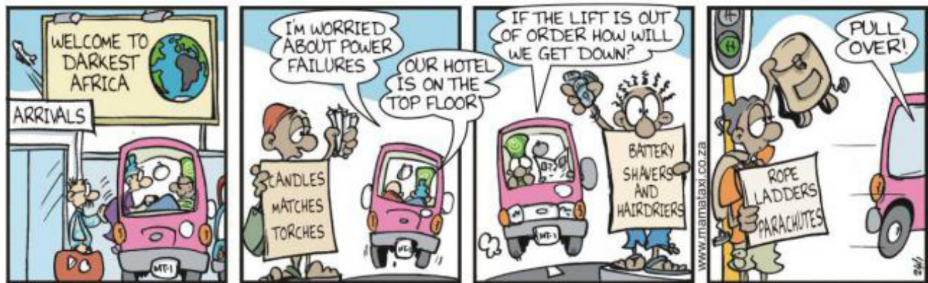
Spotprent 2 Mama Taxi het alternatiewe apparaat se waarde omskryf. 89

Mama Taxi het die vrede van buitelandse besoekers aan Suid-Afrika goed saamgevat.