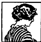
Imagen es un nombre de mujer FERNANDO RAMIREZ