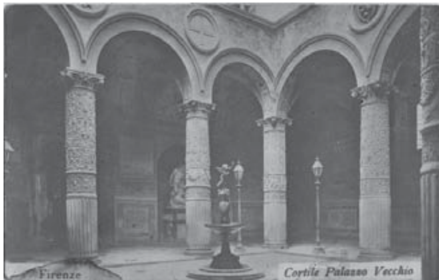
Двор Palazzo Vecchio. Открытка из коллекции Веры Хлебниковой. Фонды Дома-музея Велимира Хлебникова