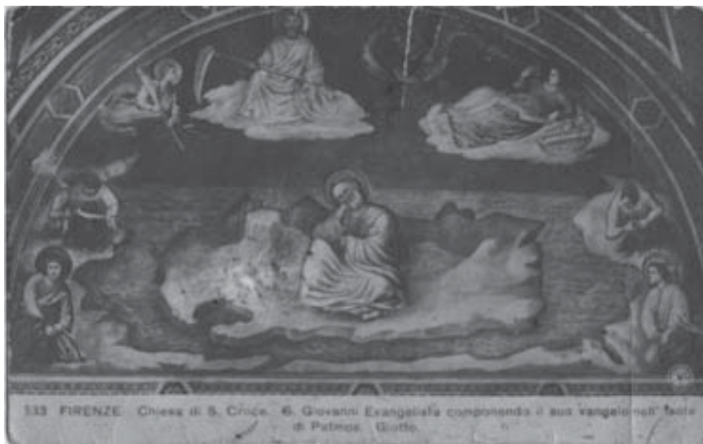
Церковь Санто Кроче во Флоренции. Открытка из коллекции Веры Хлебниковой. Фонды Дома-музея Велимира Хлебникова

Флоренция Три твёрдых стены Дни славы твоей окружали, Но крепости пали... Под игом войны. А новых побед не стяжали Веселья земного сыны. Да, крепости пали... Ворота стоят невредимы. Вот эти хранили пути К подножью Могучего Рима. Дерзал ли кто смелый пройти Без спросу сквозь них невредимо? Теперь же сквозь них пролетают Безмолвные синие ночи, И гулы их сводов сурово считают Ночные часы Санто Кроче.