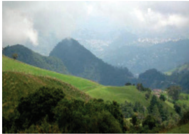
Figura 2. Paisaje fisiográfico correspondiente a relieve montañoso volcánico – erosional. A la izquierda, ladera sobre la cual se ubica la plantación de aliso ( Alnus acuminata ). A la derecha, cumulo – domo, sobre el cual se ubica el bosque secundario. Reserva Forestal Protectora Bosques de la CHEC, departamento de Caldas, región andina central colombiana.

La segunda ladera media, se encuentra ubicada sobre un paisaje fisiográfico correspondiente a un cumulo - domo (Serrato, 2009), a una distancia aproximada de 9,5 km sobre la vía anteriormente citada, vereda La Esperanza, corregimiento Río Blanco, municipio de Manizales, con uso forestal protector correspondiente a un bosque secundario, el cual presenta un bajo nivel de disturbio desde el año 1968, sobre una pendiente fuerte a muy fuerte (31 – 70%), con diferentes estratos de vegetación (Roncancio y Estévez, 2007).