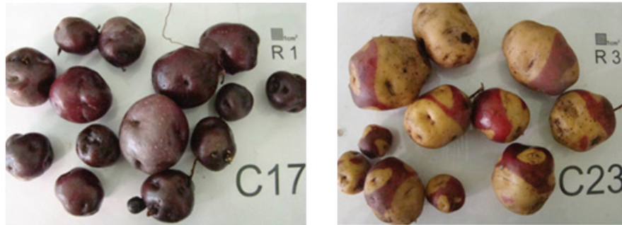
Figura 1. Genotipos de papa Solanum phureja seleccionados de la colección Universidad Nacional de Colombia.

verificar los resultados obtenidos se realizó un análisis comparativo de los cromosomas encontrados en las células en estado de mitosis y meiosis I, específicamente entre las fases de paquitene y metafase I (Gavrilenko, 2007; Howard, 1970; Höglund, 1970; Swaminathan y Howard, 1953; Estrada, 1996).