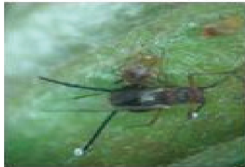
Figura 2. Adulto de Greenidea ficicola con sífinculos o cornículos en el extremo del abdomen.