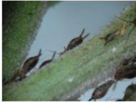
Figura 1. Detalle de una colonia de ninfas de Greenidea ficicola .