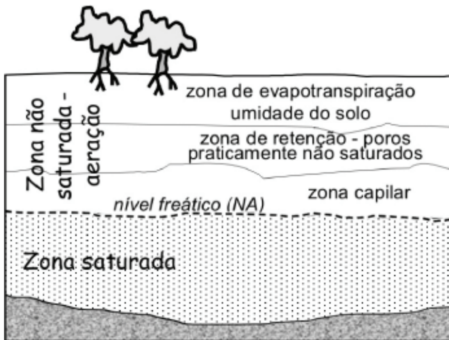
Figura 1 - Distribuição das águas no solo.

A situação A, em que o material geológico apresenta média condutividade hidráulica e profundidade do nível freático acima do recomendado, é considerada como de baixa vulnerabilidade de contaminação favorecendo os fenômenos transformativos destrutivos, sendo assim indicado o processo de sepultamento. Já a situação B, em que o material