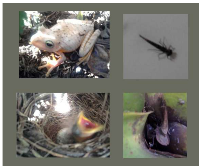
Figura 2 - Quadro de organismos

Como pode-se observar na figura 3, esta é uma pequena amostra da fauna encontrada dentro as bromélias nos dias de coleta, sendo que o ninho de passarinhos foi o que causou maior surpresa.