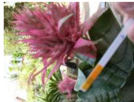
Figura 1. Medição de pH.

A identificação das larvas e pupas foi realizada pelo Centro de Controle de Zoonose de São Bernardo do Campo, SP.