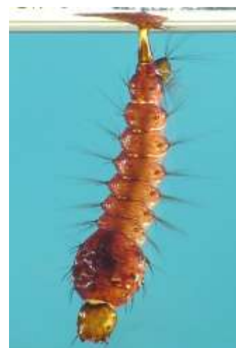
Figura 3 - Larva toxorhynchites

SCHREIBER, 1994 apud SIMÕES et al. , 2007).