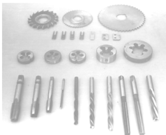
Рис. 1 – Металорізальний інструмент

Інструмент є основною складовою машинобудівного виробництва, від якості та стану якого залежить не тільки продуктивність праці, але і якість продукції, що виготовляється. Тому підвищення зносостійкості різального інструменту (рис. 1) є важливою народногосподарською задачею, вирішення якої сприяє зростанню економічності та конкурентоспроможності виробів та виробництва загалом. Питанням вивчення та вирішення даної проблеми присвячено багато робіт [1 - 9], аналіз яких показує, що перспективними методами підвищення зносостійкості інструменту є нанесення зносостійких покриттів методами осадження у вакуумі [1, 2], електроіскрового легування [3], хіміко - термічної обробки в плазмі тліючого розряду [4, 7, 8], лазерної термообробки [9] тощо. Однак, дана проблема до кінця не вирішена і залишається актуальною на даний час.