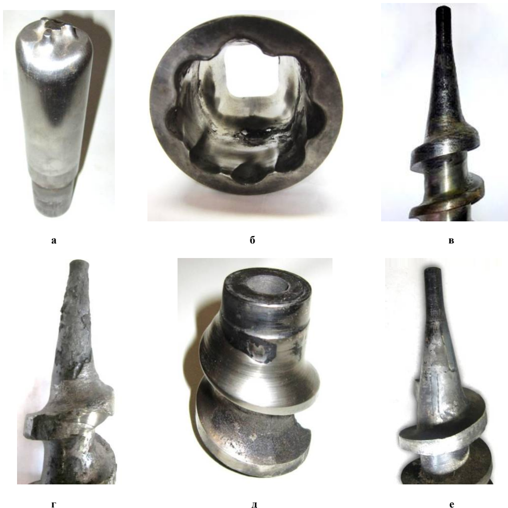
Рис. 3 – Зовнішній вигляд зношених робочих органів обладнання для виготовлення паливних брикетів: а – брикетувальний пуансон; б – формуюча втулка; в – суцільний однозахідний шнек (рівномірне зношування); г – суцільний однозахідний шнек (інтенсивне відшарування); д – вставка збірного шнека; е – суцільний однозахідний шнек з вставними твердосплавними пластинами

Зношування пуансона призводить до інтенсивного заокруглювання його формоутворюючого ребра і зменшення номінального діаметру в прилеглий зоні (рис. 3, а). В результаті цього зростає зусилля пресування і, як наслідок, енерговитрати на одиницю продукції. Крім того, по периметру торцевої поверхні виробу формується облой, що збільшує транспортний об'єм і перешкоджає технологічному зрошуванню брикетів в процесі виробництва.