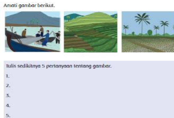
Gambar 8. Penanaman Sikap Objektif