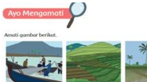
Gambar 1. Keterampilan Mengobservasi