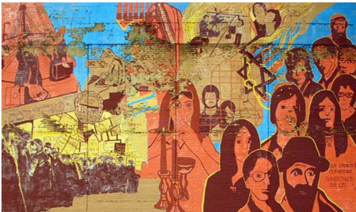
Figure 14. 'Mural, ILGWU—International Ladies Garment Workers Union—Our Strength is Our Heritage—Our Heritage is Our Life—East Broadway, Lower East Side' [Peinture murale, ILGWU—Syndicat international des femmes fabricants de vêtements—Notre Force est Notre Héritage—Notre Héritage est Notre Vie—East Broadway, Lower East Side] © Frank H. Jump, Fading Ad Blog [ http://www.fadingad.com/fadingadblog/category/judaica/ ].

voir le titre du grand journal créé par Abraham Cahan, mentionné auparavant, le Forverts ; on voit aussi les syndicalistes manifestant et le logo de l'International Ladies Garment Workers Union. En somme, un condensé des quatre décennies de vie dans le Lower East Side, mais emblématiques de toute la vie juive américaine.