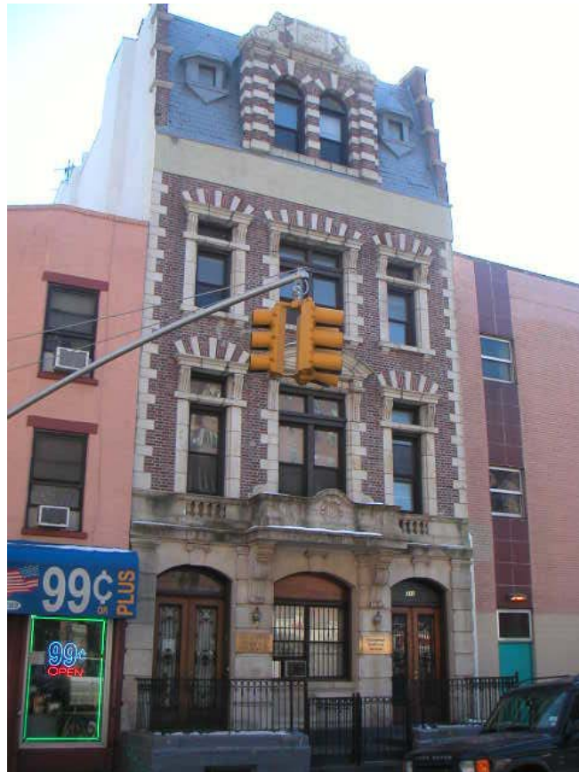
Figure 9. 'Ritualarium, formerly Arnold Toynbee Hall, 313 East Broadway' [Ritualarium, anciennement Alfred Toynbee Hall], New York Architecture, [ http://www.nyc-architecture.com/LES/LES013.htm ].

Les autres édifices caractéristiques du shtetl , outre les synagogues, étaient les écoles ( cheder ) et les bains rituels ( mikve ). Il y en avait probablement des centaines, la plupart dans des salles en sous-sol, pour capter les sources. Certains ont été établis dans des édifices séparés, comme celui-ci, dans East Broadway, qui date de 1904 (figure 9), et qui a été construit dans une ancienne église. Il ne reste plus que trois mikve aujourd'hui dans downtown New York.