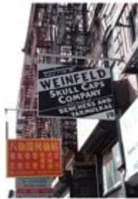
Figure 10. Boutique d'articles religieux © l'auteur.

transactions s'effectuent par internet. Elles perdurent dans un univers plus asiatique que juif (figure 10).