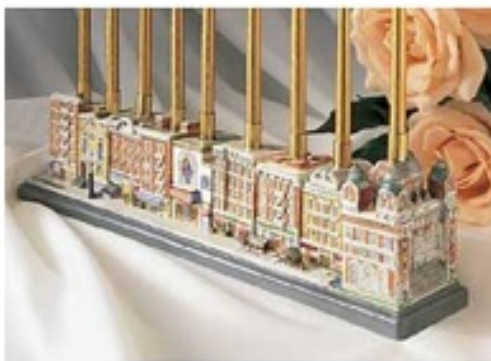
Figure 13. © Mande Weisser, 'The New World Chanoukkiah' [la Chanoukkia du Nouveau Monde], Jewishsource.com [ http://www.jewishsource.com/itemdy00.asp?T1=14605 ].

L'expansion culturelle était telle à l'époque que l'on rapporte que les habitants non juifs du Lower East Side—et il y en avait des milliers—apprirent le yiddish et communiquaient en yiddish avec leurs voisins. On raconte aussi que les agents de police irlandais qui travaillaient sur East Broadway accrochaient des amulettes juives à leurs sifflets.