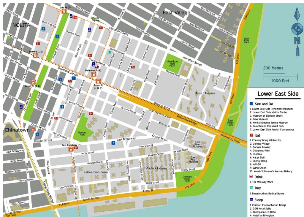
Figure 1: Carte du Lower East Side, Manhattan, 14 April 2012 © PerryPlanet, Wikimedia Commons [ http://commons.wikimedia.org/wiki/File:0089_klzwick_DSCN0779.JPG ].

quelque chose à part, quelque chose qui leur était propre. Ils firent du Lower East Side leur terre, dans un pays qui symbolisait pour eux une goldene medine (terre d'or). Pourquoi s'installer downtown Manhattan ? Certes, ils n'avaient pas les moyens de vivre uptown , où résidaient les Juifs américains qui avaient prospéré. Le quartier du Lower East Side était traditionnellement la zone de première installation des immigrants. Mais par-delà la nécessité économique, il y avait probablement aussi une dimension quasi-familiale: on restait groupé par village d'origine. Une fois downtown , ils ne se sont pas contentés de créer des structures d'habitat et de survie minimales. Le Lower East Side n'était pas qu'un territoire transitionnel, entre l'ancien monde et le nouveau. 'The neighborhood did not just come to stand for what urban historians call the area of first settlement' [La zone d'habitation en vint à représenter autre chose que ce que les historiens de la ville appellent zone de première installation], écrit l'historienne Hasia Diner. 'Rather, it was Jewish cultural authenticity—pure, untarnished Jewish cultural honesty' [C'était plutôt l'incarnation de l'authenticité culturelle juive—une authenticité juive pure, intacte] (Diner 2000 : 27).