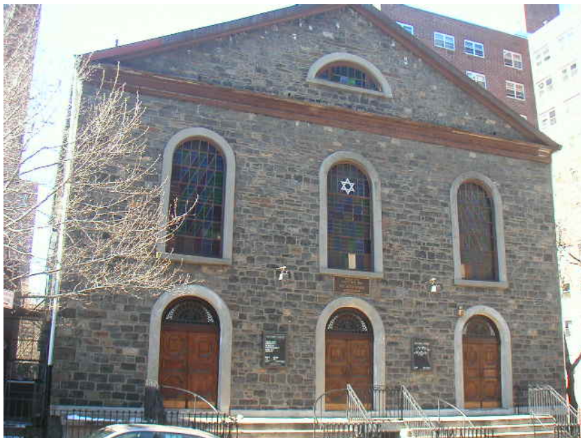
Figure 3. 'Synagogue Bialystoker' [La synagogue Bialystoker] 1998, Wikimedia Commons [https://commons.wikimedia.org/wiki/File:Bialystoker_Outside.jpg] .

juive du Lower East Side,' a écrit l'historien Marvin Gelfand (1992). Cette synagogue fonctionne toujours, mais elle est aujourd'hui en plein quartier chinois, enchâssée entre deux temples bouddhistes. Comme la synagogue d'Eldridge Street, d'autres synagogues accueillent toujours les fidèles (quotidiennement et les jours de fête).