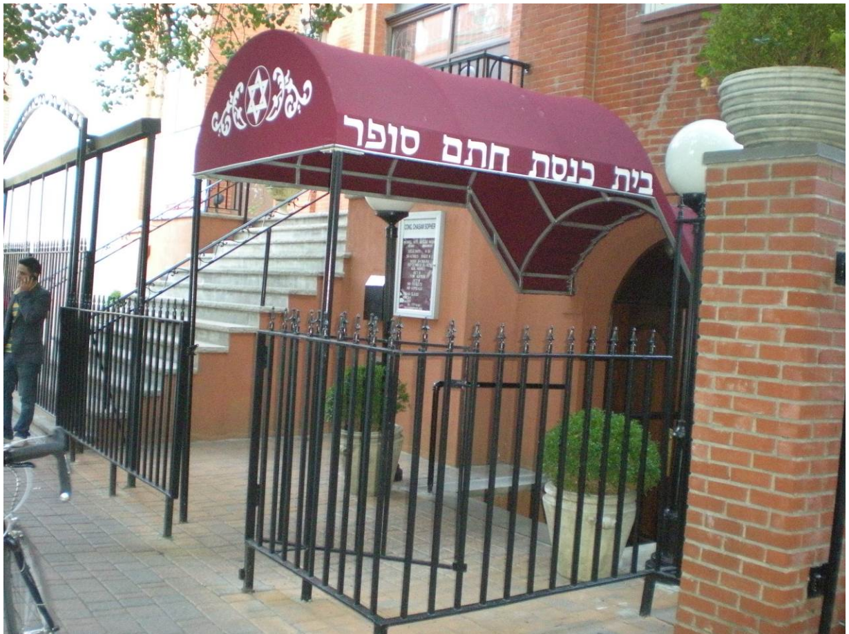
Figure 5. 'Entrance to Chasam Sopher' [Entrée de Chasam Sopher] © team_klzwick as Part of the Commons:Wikis Take Manhattan Project

[Contribution au projet de Commons: les Wikis se saisissent de Manhattan], 4 October 2008, Wikimedia Commons [ http://commons.wikimedia.org/wiki/File:0089_klzwick_DSCN0779.JPG ].