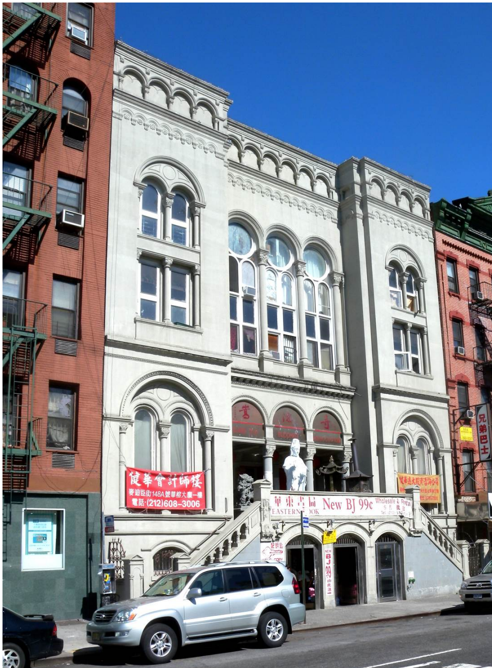
Figure 8. 'Looking Southeast Across Pike at Pike Street Synagogue, Also Called Congregation Sons of Israel Kalwarie [Synagogue], Now Serving Residential and Commercial Tenants and a Buddhist Temple, on a Sunny Afternoon' [La synagogue de Pike Street vue du sud-est et de l'autre côté de la rue. Appelée aussi Congrégation des fils d'Israel Kalwarie [Synagogue]. Y sont installés maintenant des locataires résidentiels et commerciaux et un temple bouddhique. Par un après-midi ensoleillé]

30 May 2010