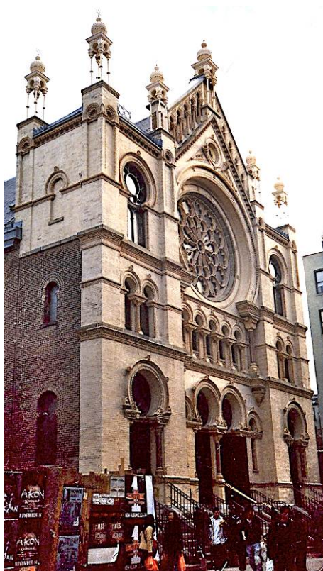
Figure 2. 'Eldridge Street Synagogue' [La synagogue d'Eldridge Street] 14 November 2006 .

Lorsqu'une communauté était plus nombreuse, plus riche, elle cherchait parfois à construire une synagogue. Géosymboles importants de ce paysage, les synagogues étaient parfois d'anciens temples protestants réaffectés au culte israélite. Une identité se superposait à une autre. D'ailleurs aujourd'hui le processus de strates culturelles n'est pas achevé: de nombreuses synagogues ont été reprises et transformées par les groupes suivants d'immigrants, par exemple Anshei Ileya (Forsyth Street), qui aujourd'hui est une congrégation adventiste hispano-américaine (on peut remarquer que l'étoile de David a été conservée) ou Barbara Church, autrefois synagogue établie par une congrégation de Suwalki en Pologne. On peut encore voir les tables du décalogue; par contre une croix a été dressée au sommet de la coupole.