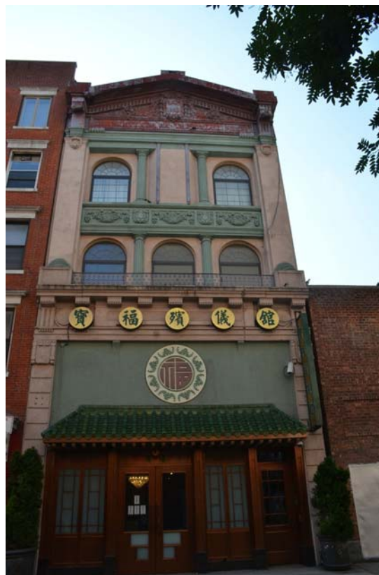
Figure 11. Kletzker Brotherly Aid Association, 5 Ludlow Street, Now a Chinese Funeral Parlour [L'Association Kletzker d'aide fraternelle ... maintenant dépôt mortuaire chinois] © 2015 Tangential Travel [ http://elirab.me/jewish/heritage-walk-on-the-lower-east-side-continued/ ].

Dernier aspect communautaire, cette fois lié à la charité, les sociétés d'entraide. Entre 1880 et 1910, quelque 300 landsmanschaftn (sociétés d'entraide) opéraient dans le quartier. On peut toujours voir l'inscription sur le fronton de la Kletzker Brotherly Aid Association sur la rue Ludlow, à l'angle de Canal Street (figure 11).