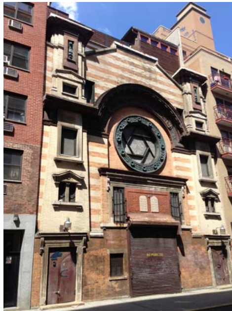
Figure 7. 'First Warsaw Congregation (Former Congregation Adath Jeshurun) [Première Congrégation de Warsaw (anciennement Congrégation Adath Jeshurun)], 58 Rivington Street, Lower East Side, NYC,' 6 July 2013.