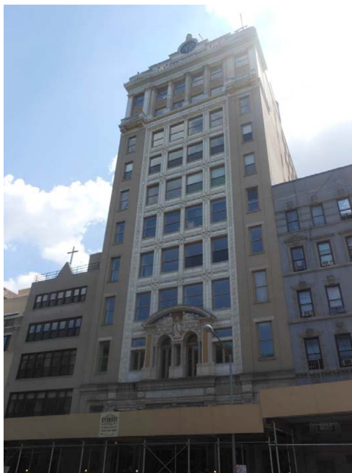
Figure 12. 'Forward Building in Lower East Side, New York City' [Bâtiment Forward au Lower East Side], 16 August 2012 © Alexisrael. Wikimedia Commons [ http://commons.wikimedia.org/wiki/File:Forward_Building_Full_View.JPG ].

Le théâtre en tant que théâtre a aujourd'hui disparu, la modernisation a eu raison de ce pan de la culture yiddish, mais jusque dans les années 1960, se jouaient des pièces en yiddish, notamment au Public Theater, sur la 2e avenue et East 4th Street.