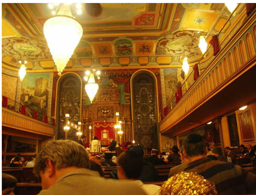
Figure 4. 'Purim Celebration in Bialystoker 2007' [Célébration de Purim à Bialystoker 2007], 3 March 2007 © Juda S. Engelmayer, Wikimedia Commons [https://commons.wikimedia.org/wiki/File:BialystokerPurim07.JPG] .