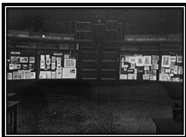
Figura 7. Sala de leitura Kulturwissenschaftliche Bibliothek Warburg de Hamburgo