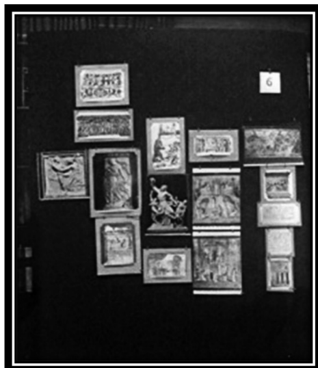
Figura 5. Atlas de imagens Mnemosyne , prancha 6, em torno de Laocoonte, 1927-1929