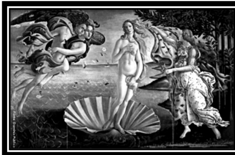
Figura 1. O nascimento de Vênus, Sandro Botticelli