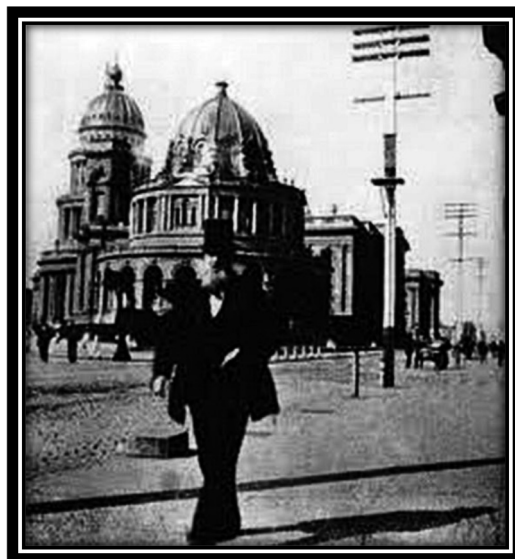
Figura 9. Um transeunte em São Francisco, fevereiro de 1896

doras de cestas da tradição antiga. Por trás do homem da cartola, nos fios do telégrafo que estriam no céu e abolem o espaço, Edison, o “feiticeiro da eletricidade” [...] havia aprisionado o relâmpago (Michaud, 2013, p. 218-219).