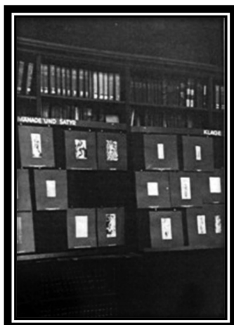
Figura 6. Sala de leitura Kulturwissenschaftliche Bibliothek Warburg de Hamburgo