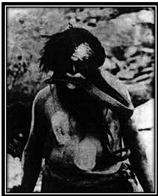
Figura 8. Índio Hopi, 1924. Washington, Biblioteca do Congresso