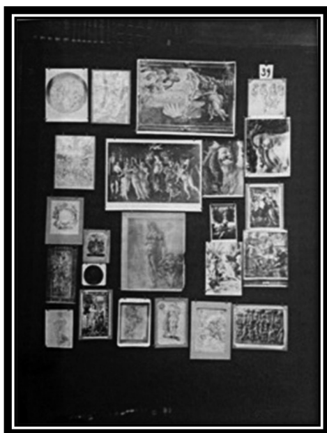
Figura 4. Atlas de imagens Mnemosyne , prancha 39, a ninfa em movimento, 1927-1929

Entre essas questões elucidadoras da teoria de pós-vida, encontrarse-ia a criação do Atlas Mnemosyne (figuras 4 e 5). A grande proposta desse Atlas seria poder dispor e visualizar, ampla e paralelamente, diversas imagens em um mesmo plano, o que permite uma exploração e um desdobramento até então impensáveis para a imagem. Por meio da fototeca e desse Atlas, Warburg permitiria um desdobramento das possibilidades de seu pensamento por meio das imagens. Possibilidades estas registradas pelo pesquisador com o auxílio da fotografia.