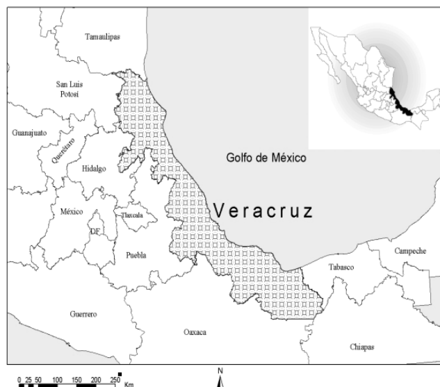
Mapa 1. Localización del estado de Veracruz.