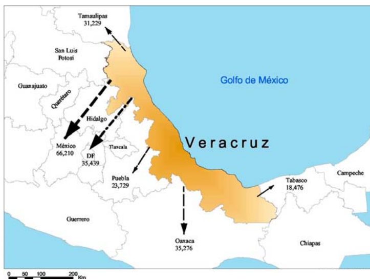
Mapa 2. Destino de los emigrantes veracruzanos, 1990-1995.

Fuente: Elaborado por el Sigef de El Colegio de la Frontera Norte.