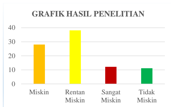
Gambar 15. Grafik Hasil Penelitian

Berdasarkan hasil perhitungan dengan menggunakan metode WASPAS, dan diimplementasikan dalam bentuk aplikasi sistem, berdasarkan dari 89 sampel yang diteliti terdapat 12 rumah tangga sangat miskin, 28 rumah tangga miskin, 38 rumah tangga rentan miskin dan 11 rumah tangga tidak miskin. Hasil yang diperoleh dapat dilihat pada grafik di bawah ini: