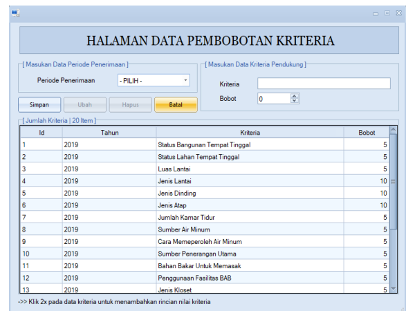
Gambar 3. Form Halaman Pembobotan Kriteria

Form ini diakses untuk melihat, menambah, mengubah, menghapus dan menentukan bobot kriteria.