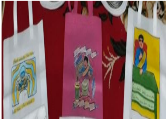
Gambar 8. Tas berbasis kearifan lokal.