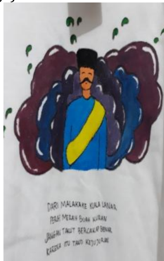
Gambar 5 Baju Kaos Berbasis Kearifan Lokal Budaya Melayu

Souvenir grafiti berupa baju menggunakan nilai moral dari pantun Melayu Deli berupa nilai budi pekerti yang sesuai dengan isi pantun yaitu Dari Melaka ke Kuala Lanar, Pergi meraih buah kuran, Jangan takut bercakap benar, Karena itu tanda kejujuran "