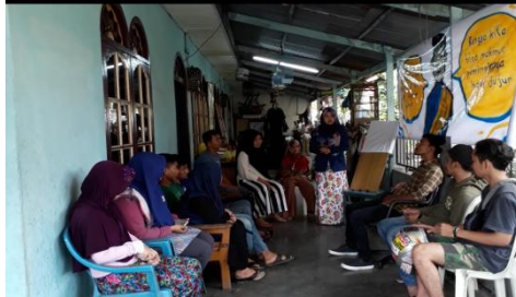
Gambar 2. Pengajaran dan Penyampaian Pesan Moral dan Watak Cerita Rakyat Pak Belalang