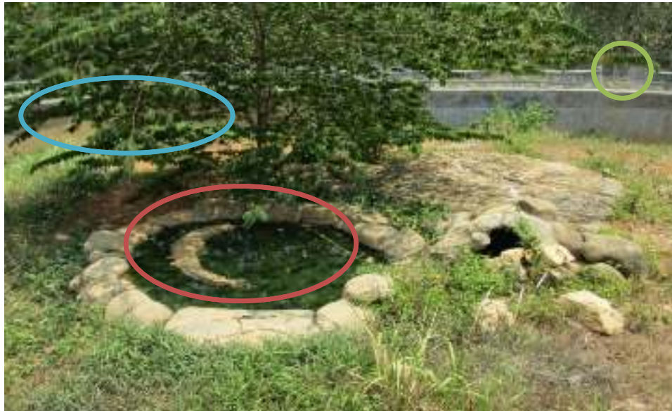
Gambar 4. Kandang buaya di Taman Satwa Lembah Hijau Bandar Lampung.

berinteraksi dengan satwa; (b) Pada lingkaran biru penempatan satwa untuk jenis buaya muara ( Crocodylus porosus ) tidak sesuai, karena satwa berada di dekat pinggir kandang yang dapat terjangkau oleh pengunjung; (c) Pada lingkaran merah tampak air di dalam kolam buaya terlihat kotor, dan sebaiknya air diganti seminggu sekali; dan (d) Tempat berteduh kurang sesuai, yang ternaungi hanya satu ekor yaitu buaya Irian ( Crocodylus novaeguineae ).