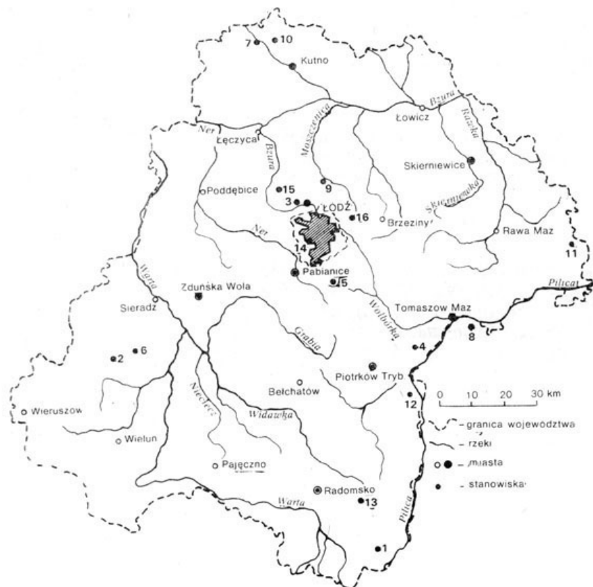
Ryc. 1. Rozmieszczenie stanowisk na terenie województwa łódzkiego

Distribution of localities on the territory of Łódź — voivodship