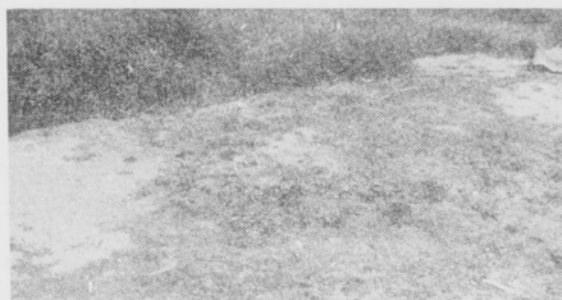
Kuva 1. Alueella, jolle lumen pääsy estettiin, kuolivat talvikautena 1951—1952 kaikki luonnonvaraiset kasvit (samana talvena säilyivät lumen alla palettumattomana mm. salaatti ja maahan jääneet perunat.)

Abb. 1. Auf einer Fläche, die schneefrei gehalten wurde, starben in der Winterzeit 1951—52 alle Wildpflanzen (in demselben Winter erhielten sich unter dem Schnee unerfroren u.a. Salat und im Boden gebliebene Kartoffeln).