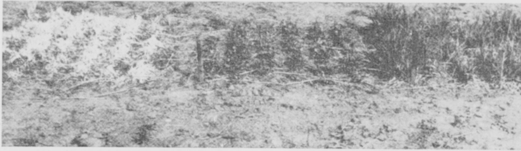
Kuva 4. Sclerotinia borealis tuhonnut koiranheinän (vas.). Puna-apila (kesk.) ja nurmipuntarpää (oik.) talvehtineet hyvin (kevällä 1953).