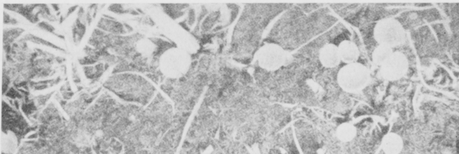
Kuva 5. S. borealis en apoteekioita nurminatakasvustossa (edellisenä yönä lämpötila oli −7°C ja kuvaa otettaessa −1°C).

S. borealis -tuhoja esiintyi heinääkasvamattomasta mäntyvaltaisesta metsästä raivatun pellon jo ensimmäisen kylvöksen 1. vuoden nurmessa. Siten tuntuu ilmeiseltä, että koteloitiösaastutuksella on sienien leviämisessä tärkeä merkitys. V. 1955 suoritetuissa tutkimuksissa todettiin, että kotelomaljoja alkoi kehittyä syyskuun 10. päivän tienoilla. Sen jälkeen niitä ilmaantui heinänurmiin hyvin runsaasti. V. 1951 kylvetyissä nurminatakoeruuduissa niitä 5. 10. oli keskimäärin 43 kpl/m 2 . Vaikka maa oli pakkasessa (−7°C) jäänyt, olivat S. borealis -apoteekiot paleltumattomia ja terveen näköisiä (kuva 5). Sisälle tuotuinakin ne pysyivät useita päiviä elossa. Kotelomaljojen läpimitta oli 1—6 mm, itiökoteloiden koko (50 mittausta) 175 (114—208) × 16.6 (7,8—13,0) μ, koteloitiöiden (100 mittausta) 14.8 (12.0—18.0) × 7.0 (5,3—8.3) μ. Sklerootioista kasvatettu rihmasto kasvoi steriloidulla apilauute-