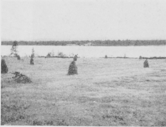
Kuva 6. Poutakesän 1953 heikko heinäsaato ensimmäisen vuoden timoteinurmessa.

Abb. 6. Schwacher Heuertrag im trockenen Sommer 1953 auf erstjähriger Timotheewiese.