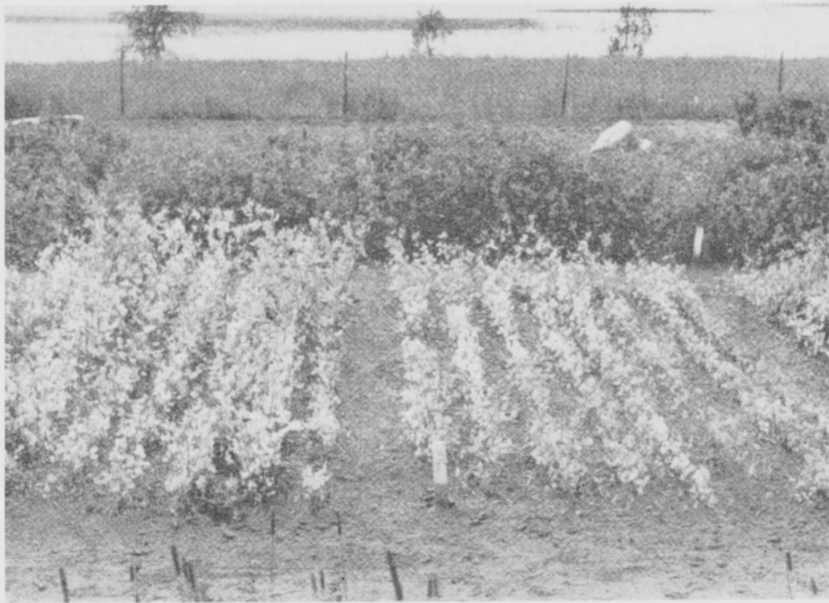
Kuva 8. Edessä nystyräbakteereilla siirrostamaton, takana siirrostettu puna-apila. Etuoikealla ja siitä takavasemmalla oleva koeruutu ei saanut typpilannoitusta.

Abb. 8. Vorn mit Knöllchenbakterien ungeimpfter, hinten geimpfter Rotklee. Die vorn rechts und die links davon nach hinten zu gelegene Versuchsparselle ohne Stickstoffdüngung.