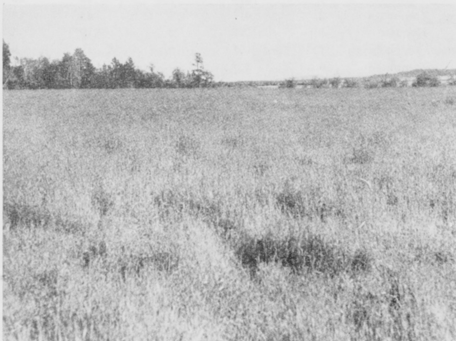
Kuva 3. Ensimmäisen vuoden timoteinurmi, jossa S. borealis on aiheuttanut aaltomaista kasvuston korkeusvaihtelua.

Kanadalainen timotei oli taudinarempi kuin kotimainen. Yleensäkin niissä nurmikasvikannoissa, jotka olivat talvenarempia, S. borealista esiintyi eniten. Koiranheinä (kuva 4) ja Poa trivialis sairastuivat ankarasti sellaisinakin vuosina, joina timoteissa tautia esiintyi vain niukasti. Nurminata ( Festuca pratensis ) näytti ensim-