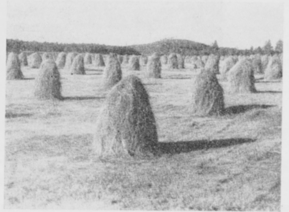
Kuva 7. Heinäsato v. 1954 (sama pelto kuin kuvassa 6).

Abb. 6. Schwacher Heuertrag im trockenen Sommer 1953 auf erstjähriger Timotheewiese.